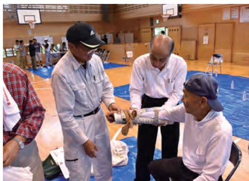
▲けが人の応急手当の訓練

※2 災害の発生または災害のおそれがある場合、住民が避難し、災害の危険性がなくなるまで、または自宅などが被災した際に必要な期間滞在し、避難生活を送る場所です。