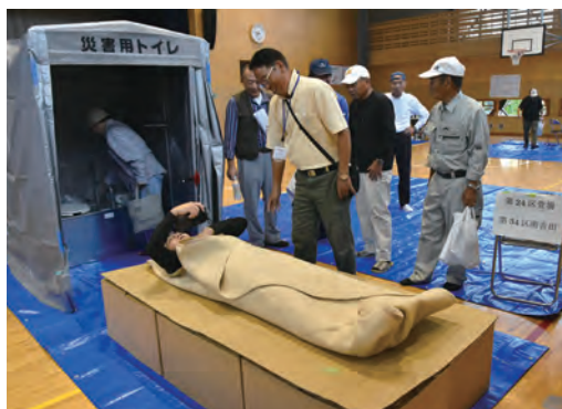
▲段ボールベッドの寝ごこちを体験