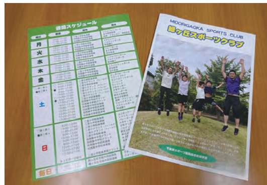
▲市内公共施設で入手できます

年齢や運動量に合わせてさまざまなスポーツや文化活動に参加できますので、興味のある方はぜひお問い合わせください。