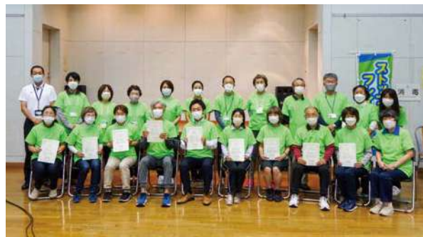
▲受講後、認定証が授与されます

フレイルチェックでは、フレイルサポーターが口腔機能や手足の筋肉量などの測定を行い、フレイルの状態かどうかを確認します。また、フレイル予防のためのポイントなどを紹介します。