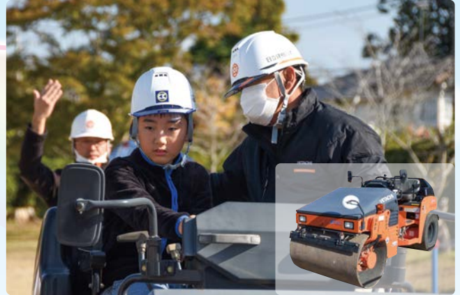
▲サイドミラーを見ながらばっちりバック！

グラウンドには高所作業車、油圧ショベル、振動ローラが配置され、児童は操作方法を教わりながら実際に体験し、「楽しかったし、災害の時は人を助けることもできてカッコいいと思った」と目を輝かせていました。