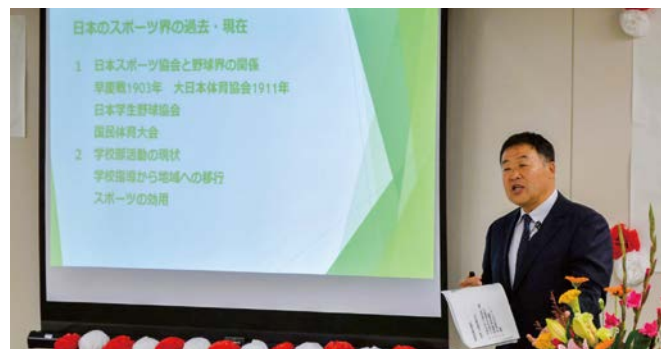
▲「世界一の侍の育ち方」と題して講演