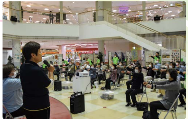
▲腕を前に上げる体操は市の愛唱歌「いつも憧 あこがれ 憬」に合わせて

来場者の中には、もばら百歳体操は初めてという方も多くおり、丁寧な解説のもと実践。手足に重りを付け、歌に合わせて7つの運動をするのはつらいという声も上がりましたが、離脱する方もおらず、やり遂げた皆さんの表情は晴れやか。“住み慣れた地域でいつまでも元気に暮らす”ことを目指す、もばら百歳体操の啓発は大成功です。