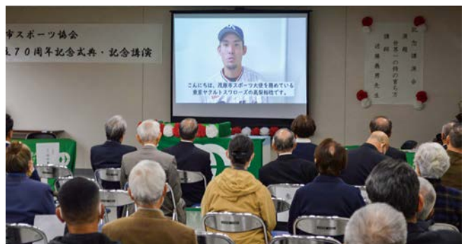
▲今後の抱負や茂原の思い出なども語りました