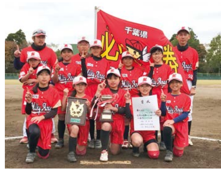
▲ミルキーエンジェルズ

☆第17回春季全日本大会・第34回関東選抜大会千葉予選会 優勝 ミルキーエンジェルズ ※全国大会への出場が決定 (3月に京都府で開催予定)