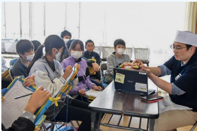
▲オンラインで参加している児童にも和菓子を見せながら