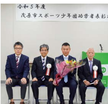
▲受賞者を囲んで記念撮影