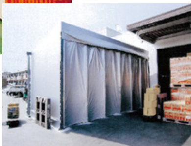
施工例：テント倉庫