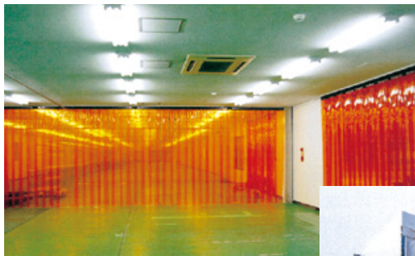
施工例： 工場内間仕切り