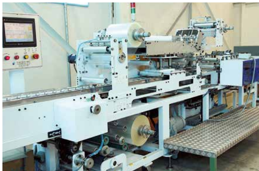
全自動割箸包装機