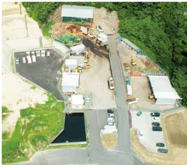
リサイクル施設全景