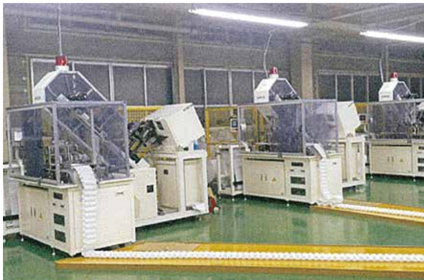
ポケットコイルマットレス コイリングマシン