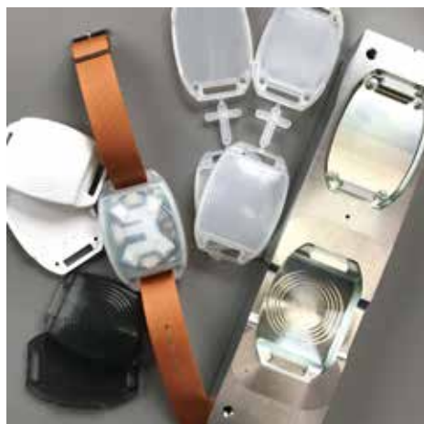
簡易金型による筐体開発

地域連携での商品開発に取り組んでいます。少量生産開発支援サイトにて、3Dデータ設計・3Dプリンター出力・簡易金型での短納期による成形を提案しています。