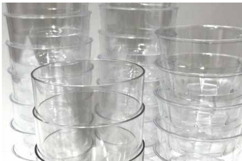
透明グラス デザートカップ

お客様の夢をともに作っていく工場です。 プラスチック製品のことがならなんでもご相談ください。