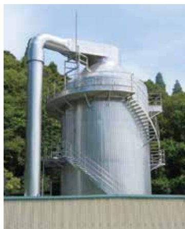
スプレードライヤー

顧客が日本製鉄を始めとした大手鉄鋼各社であり、鉄鋼生産に欠かせない製品です。鉄鋼メーカーが新製品、新製鋼方法を推し進めて行くと同時に、常に改良、改善、又は新機能を付加した商品開発を行い続け、高品質の鉄づくりに貢献します。