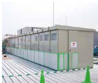
当社の得意とする多連結盤(20メートル超)

弊社は1960年創業以来、各種受・配電盤及び機械設備のフレームやユニットを製作してまいりました。1973年に茂原に工場を開設し、50年にわたるお客様のご指導により、昨今さまざまなニーズに応えるとともに研究開発を含む「創造型企業」と成長しております。