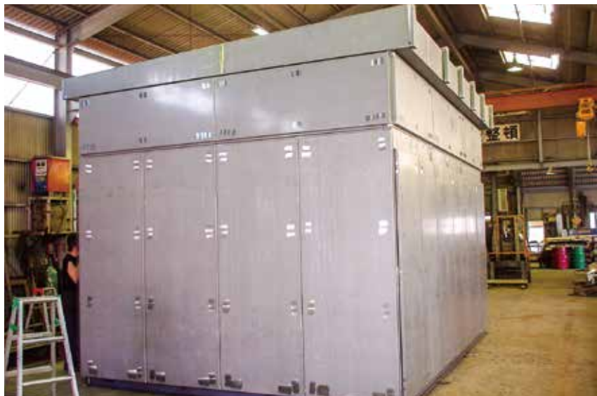
某変電所向け特高キュービクル