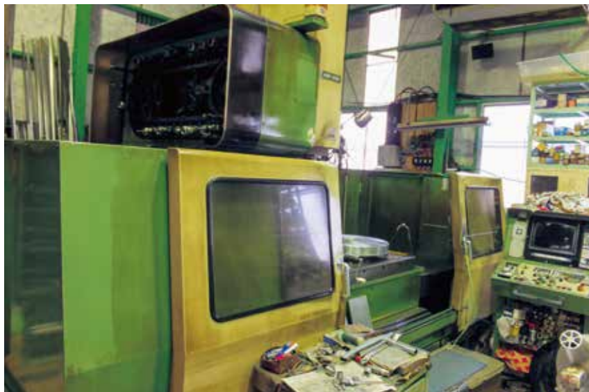
マシニングセンター

主要設備も充実し、お客様のご要望にお応えし、納得のいく納品を心掛けています。設計段階からのご相談にも応じます。マシニングセンターの加工依頼をお待ちしております。