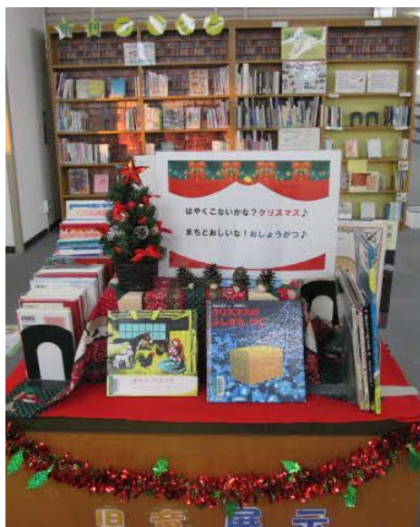
(テーマによる児童書の展示)