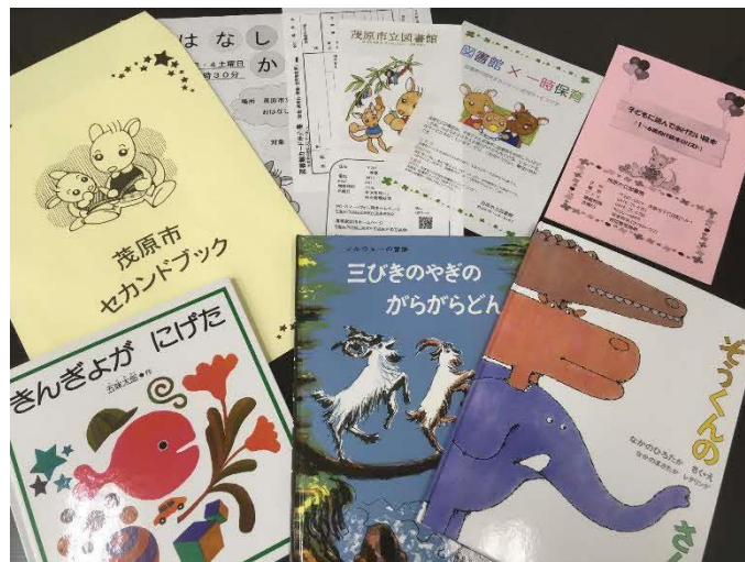
(セカンドブックパック)

<目標> ブックスタート配付率 R1年度98% → R7年度堅持 セカンドブック受渡率 R1年度40% → R7年度50%