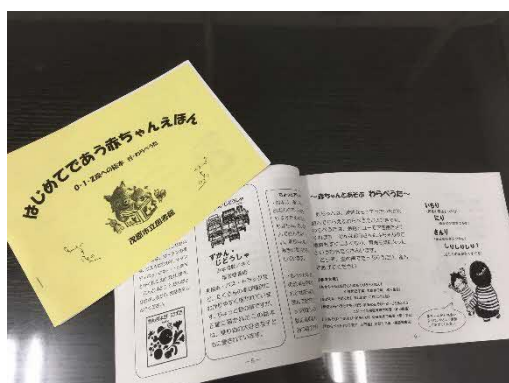
(はじめてであう赤ちゃんえほん)