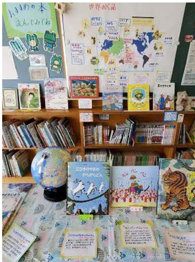
(学校司書による展示)