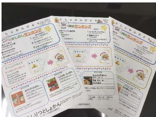
(小学生向け図書館だより)