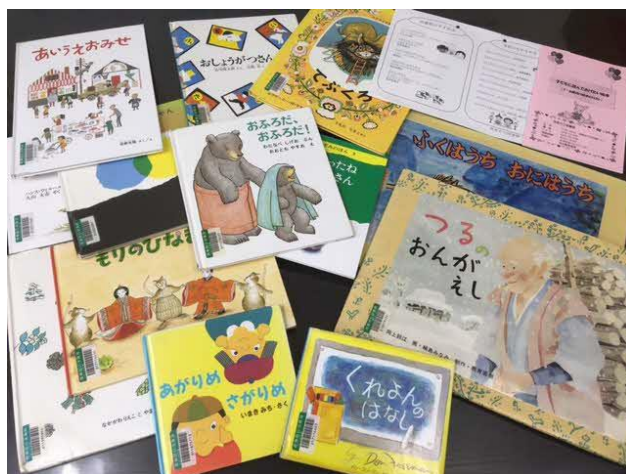
(団体貸出する絵本・紙芝居)