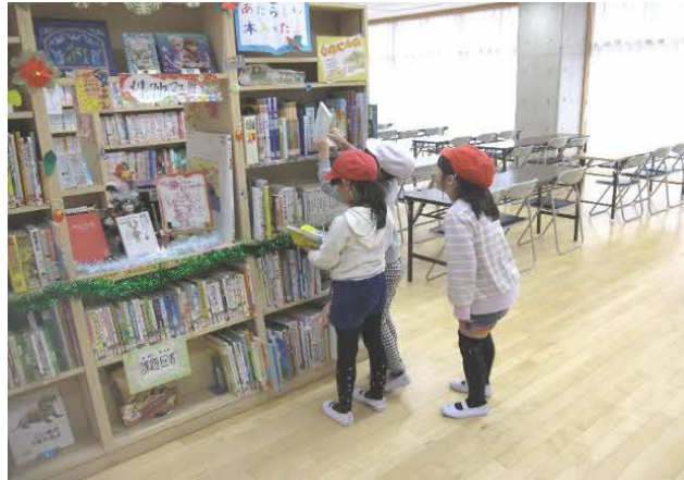
(学校図書館の利用)