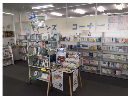
(ティーンズコーナー)