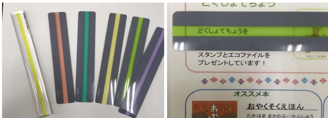
リーディングトラッカー