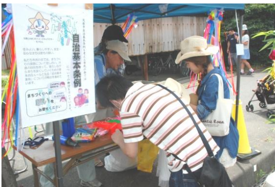
願い事短冊募集の様子

子育てや福祉、まちの活気や子どもたちの将来の夢など、 70 枚を超える短冊にさまざまな願い事をお寄せいただきました。