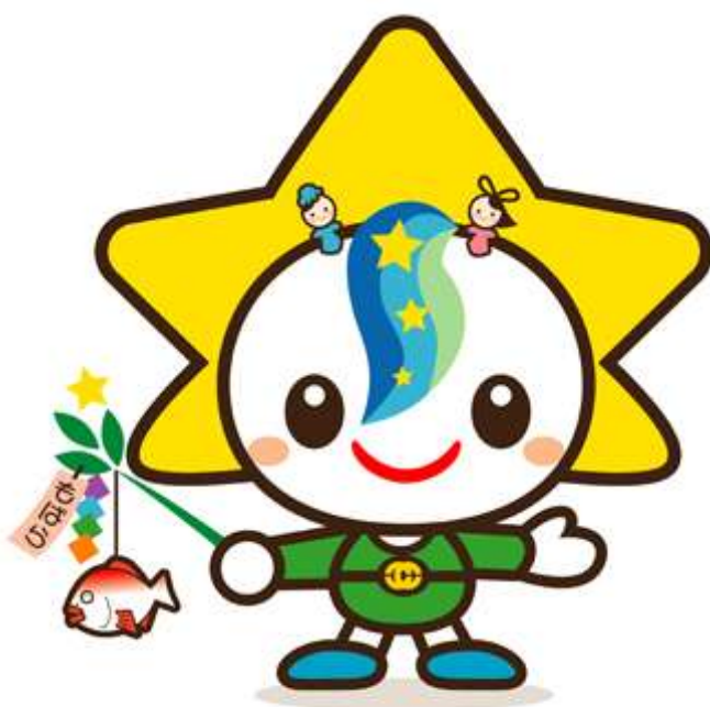
茂原七夕まつりマスコットキャラクター モバリん