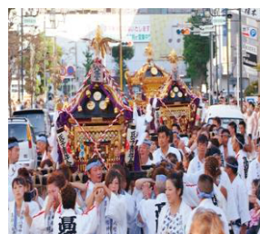
秋祭り 神輿(茂原八幡、 高師八幡神社)