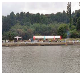
水と緑のネットワーク 八田堰(コスモス まつり)