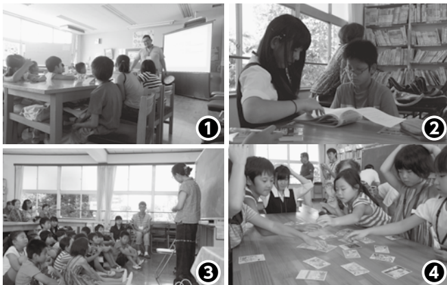
▲①英語あそび②勉強会③絵本読み聞かせ④房総かるた体験