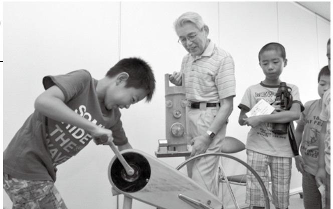
▲人力発電に挑戦する児童

太陽光調理器を手作りしてゆで卵づくりに挑戦したり、腕力で車輪を回転させて電球の明かりをつける実験を行い、電気を発生させることの大変さを体感していました。