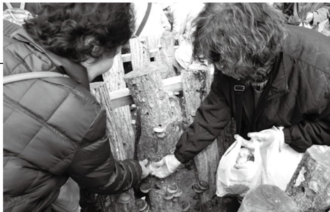
▲袋いっぱいシタケを詰め込む参加者

28人の市民が参加した今回のツアーでは、花の栽培農家の見学やシタケ栽培農家で収穫体験、旬の里ねぎぼうずでの買い物など一日かけて茂原の農業を楽しみました。