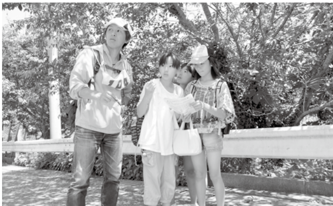
▲みんなで協力しながらゴールを目指しました