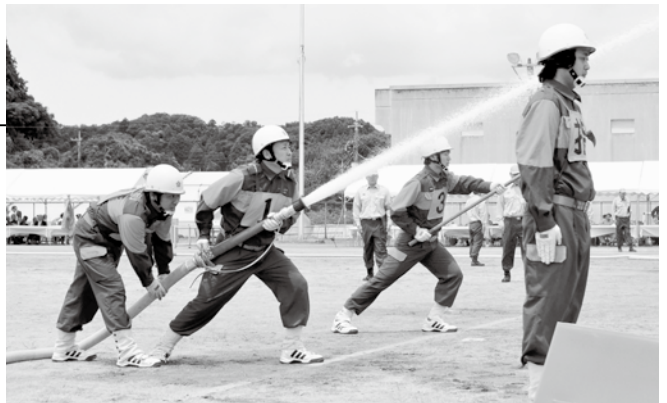
▲第1支団第3分団第1部の機敏で正確な放水

「第34回長生支部消防操法大会」が長南町陸上競技場で開催され、茂原市から6チームが出場しました。梅雨の晴れ間にも恵まれ、団員達は日頃の訓練で培った成果を十分に発揮。ポンプ車操法の部で第1支団第3分団第1部（市内早野・緑町・長清水）が最優秀賞に輝き、7月25日㊤に行われた県大会に出場しました。