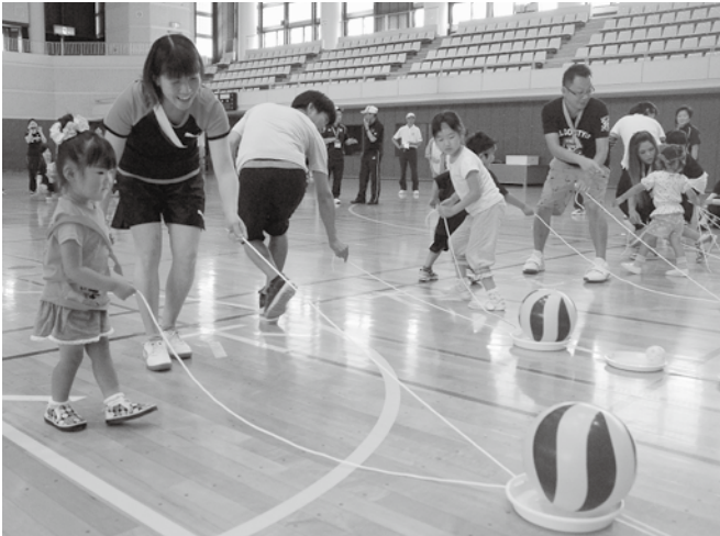
▲親子かるがもレース

今回は、約300人が参加し、パン喰い競争や綱引きなど10種目の競技で熱戦が繰り広げられ、参加した親子は声を掛け合い汗を流していました。