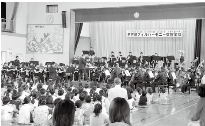
▲心に響く大迫力の音色が奏でられました