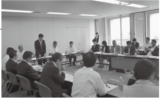
▲同会議は、産業界・学識経験者・金融機関・住民による委員で構成されています。

今後は、10月末までに、本市の特性を活かした「茂原市まち・ひと・しごと創生総合戦略」を策定していきます。