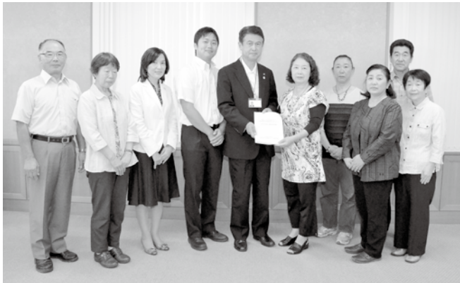
▲同協議会は、学識経験者・市議会議員・一般公募による委員で構成されています