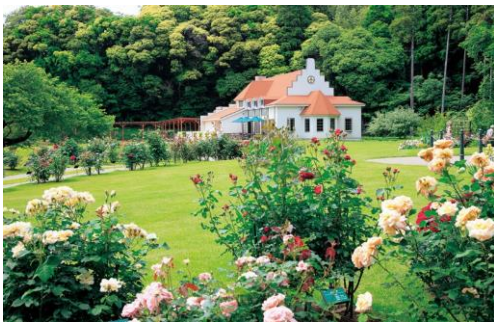
レイクウッズガーデンひめはるの里