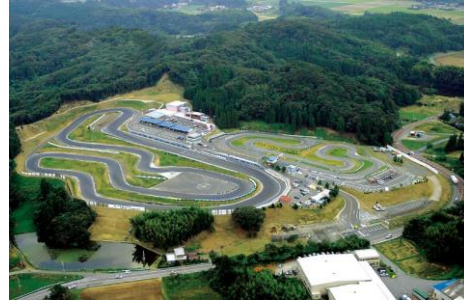
茂原ツインサーキット