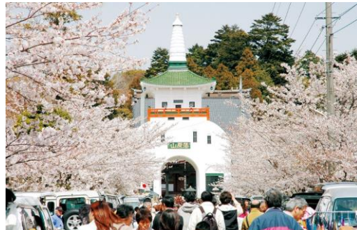
藻原寺(そうげんじ)