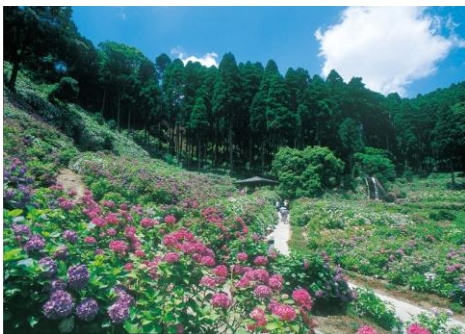
あじさい屋敷(服部農園)