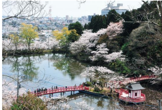
茂原公園(日本さくら名所100選)