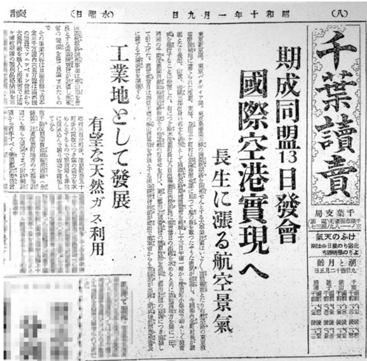
用地が決まったことを伝える新聞記事 (昭和10年1月9日付)