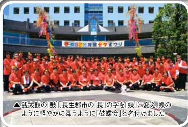
▲ 銭太鼓の「鼓」、長生郡市の「長」の字を「蝶」に変え、蝶のように軽やかに舞うように「鼓蝶会」と名付けました