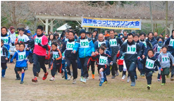
▲昨年のつつじマラソンの様子