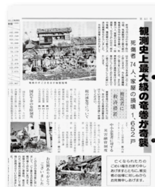
▲平成3年1月号(タブロイド判)の記事