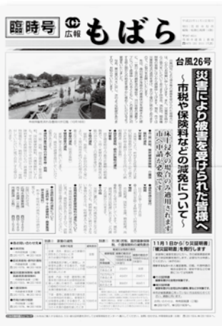
▲タブロイド判、2ページで38000部発行されました