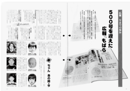
▲創刊から42年で500号を迎えました