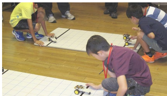
★第2部 ロボットの組み立てとプログラム ロボットを組み立て、プログラムを組んで動かします。