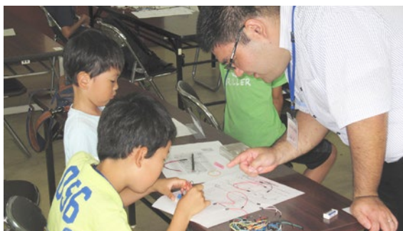
★第1部 電子工作実験 LED（発光ダイオード）を点滅させる回路を作ります。

電子回路の作製やロボットの組み立てを楽しんでもらい、子どもたちの科学に対する関心を高めます。