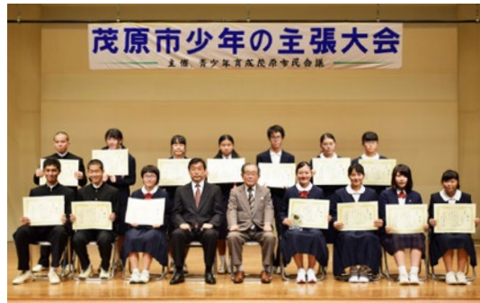
▲昨年の少年の主張大会

お問い合わせは、生涯学習課（9階） ☎(20)1559、FAX(20)1607へ。