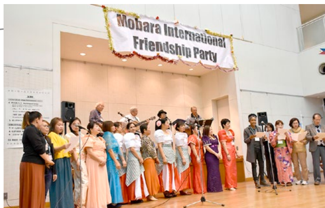
▲「We Are The World」を熱唱。皆の心がひとつに

会場は、フィリピンの伝統的なダンスの披露や、合唱、ゲームで盛り上がり、お菓子やスープなども用意され、子どもも大人も楽しんでいました。