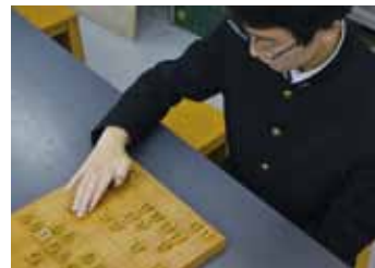
▲指し手も力強いです