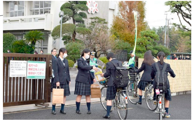
▲生徒一人ひとりに手渡しました

生徒たち自らも啓発に参加し、校門付近で自転車安全運転の意識向上と放置行為防止を呼びかけました。