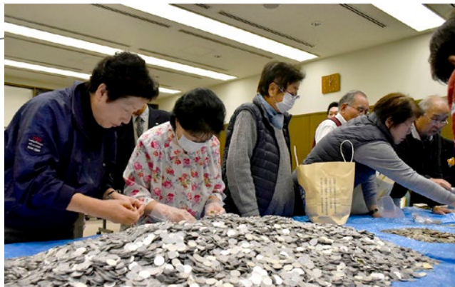
▲一枚一枚に想いが込められています

この募金で集まった611,684円は、地域の身近な福祉活動に役立てられます。寄付した方の想いもきっと届くことでしょう。