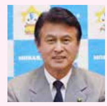
田中 豊彦 (茂原市長)