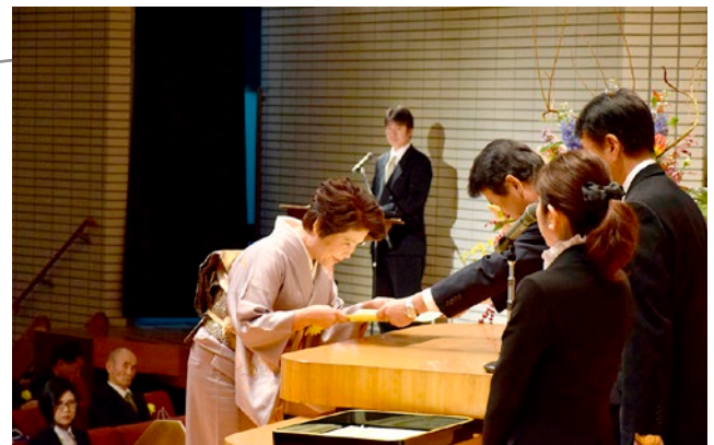
▲8つの功労別に代表者が受け取りました

これを記念し、茂原市民会館で「茂原市制施行65周年記念表彰式」が挙行され、さまざまな分野で市政に功績のあった229人と14団体に表彰状および感謝状が贈呈されました。