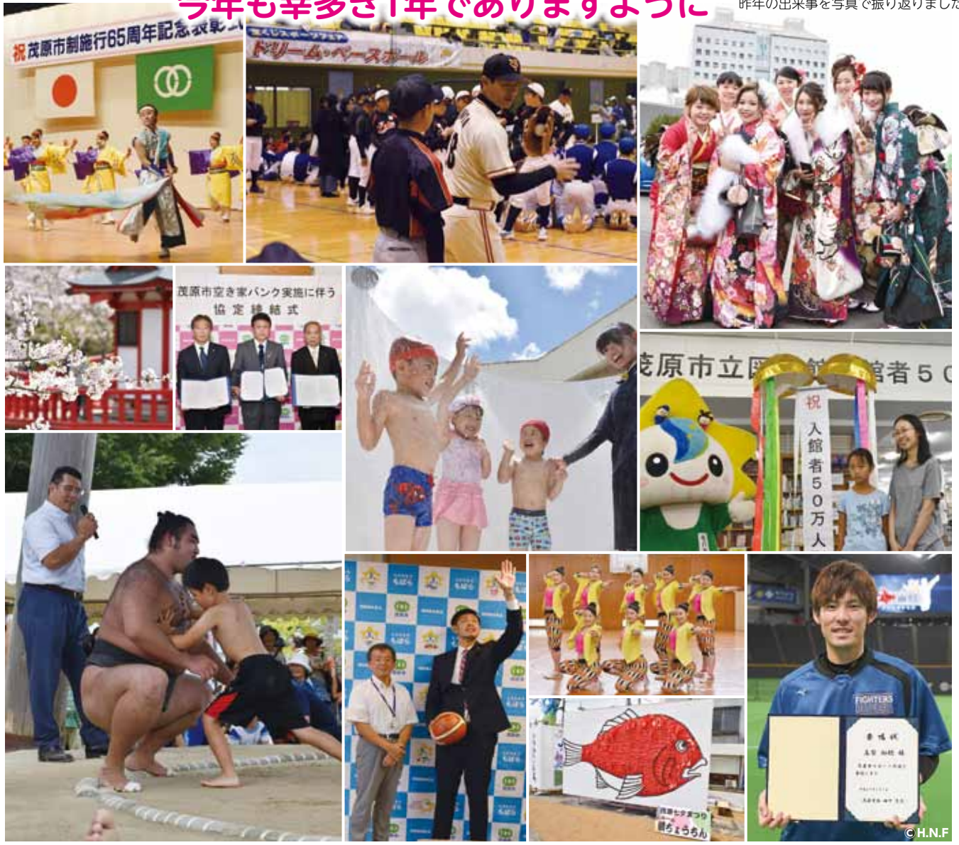
昨年の出来事を写真で振り返りました