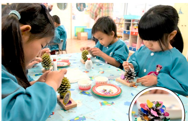
▲どんなツリーができるかな？