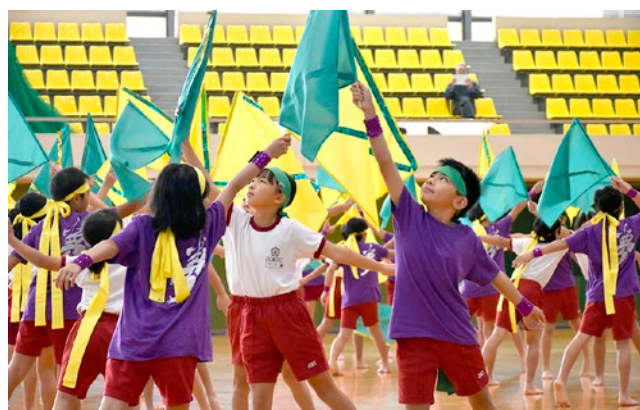
【優秀賞】小学校の部「夢への挑戦」(二宮小学校)