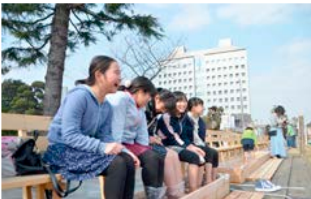
▲体がとても温まる足湯「冬タナの湯」