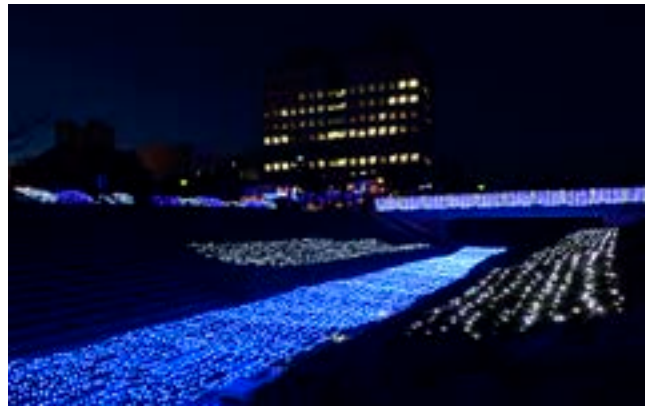
▲会場周辺がイルミネーションで彩られました