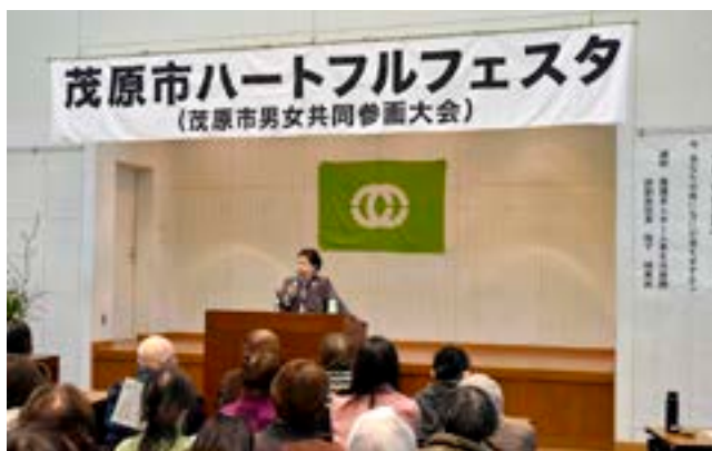
▲165人が集まった会場からは、笑い声もあふれていました