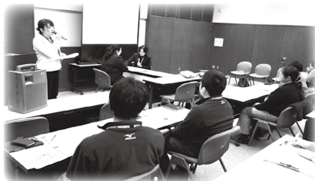
▲保健センター職員による出前講座の様子

市では、自殺や精神疾患についての正しい知識や、自殺の危険を示すサイン、また危険に気づいたときの対応方法について、出前講座としてゲートキーパー養成講座を実施しています。詳しくは、保健センターへ。