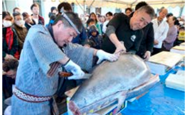
▲約80kgのマグロを解体しました

夜には市内小学6年生が制作したPETボトル灯籠やイルミネーションが点灯。プロジェクションマッピングも実施され、冬の茂原が美しく彩られました。