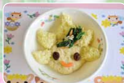
▲公立保育所での「モバリんライス」

お問い合わせは、企画政策課(4階) ☎(20)1516、FAX(20)1603へ。