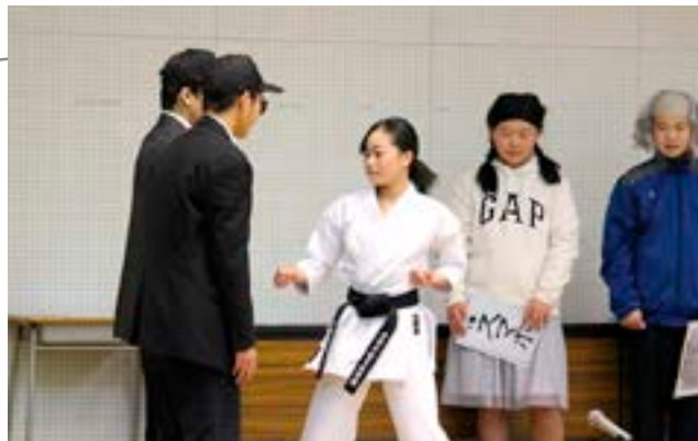
▲悪者たちをやっつける「正義の空手家」

これは、「消費者」が必要な能力を身に付けるとともに、地域のつながりを強くすることを目的に開かれたもの。茂原中学校有志による寸劇が披露されると、会場には笑いと感嘆の声があがっていました。