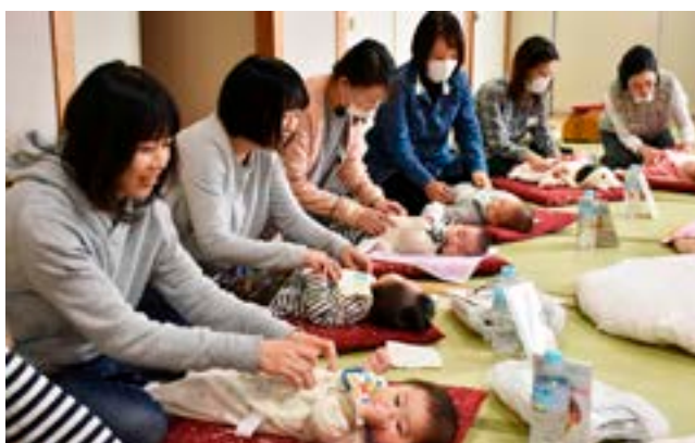
▲親子に大切な「ふれあい遊び」も体験しました