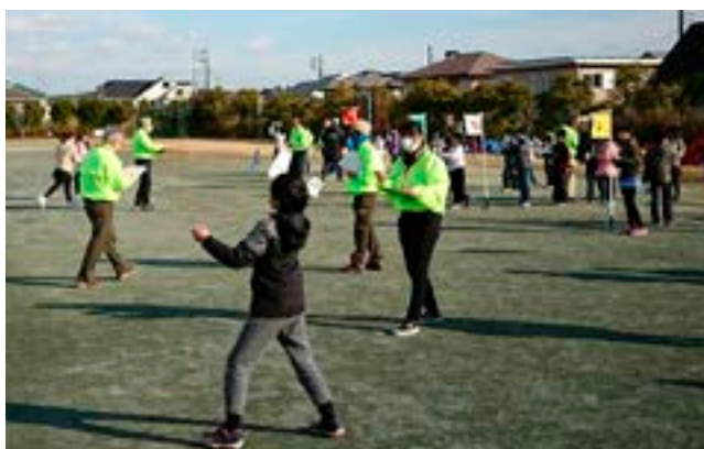
▲自分で組み立てた飛行機を思う存分飛ばしました