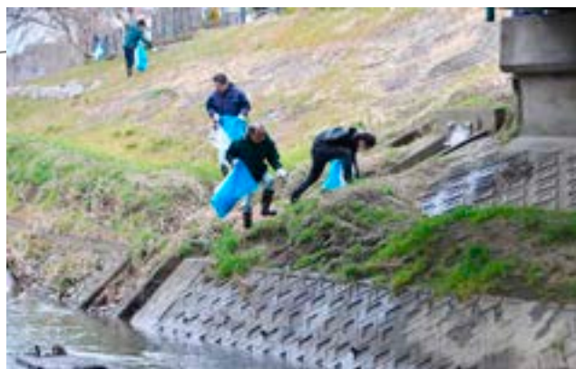
▲約1.4トンのゴミが集まりました

参加者たちは、慣れない斜面での作業に戸惑いな がらも、散乱した空き缶やペットボトルなどのゴミ を回収。川とその周辺はとてきれいになりました。