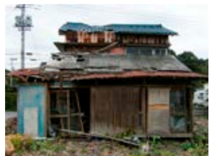
▲管理されていない空家

○空家等の対策については、適切な管理が行われていない空家等が防災、衛生、景観等の生活環境に深刻な影響を及ぼしており、本市においては平成25年現在4,080戸、全建物総数の約9%を占めており、国において地域住民の生活環境の保全、空家等の活用を目的として、「空家等対策の推進に関する特別措置法」が平成27年に施行され、市町村の役割として空家等対策