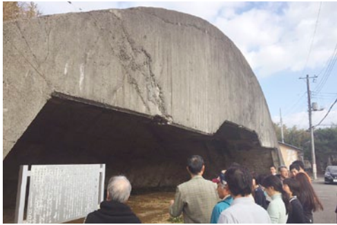
▲もばら魅力発掘キャラバンで訪れた掩体壕

基本方針では、シビックプライド（わがまちに対する誇りや愛着、共感）の醸成を図り、交流人口の拡大、定住人口の増加および地域経済の活性化につなげていくことを目指しています。策定にあたり、現状や課題、市の持つ魅力などについて、アンケートなどの意識調査や市民参加のワークショップの結果などからデータ分析を行いました。この基本方針に記載されている方向性のもと、今後、さまざまなシティプロモーションの事業を市民の皆さんと一緒に実施していきます。