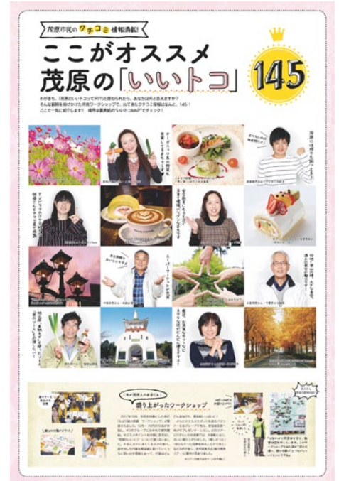
▲市民の皆さんと一緒に考えたタブロイド紙が完成!!

また、まちの空気・雰囲気をもとにし、このような潜在力があると示し、現在の姿でなく、一緒に未来のまちを創り出そうとするブランドメッセージを策定しました。