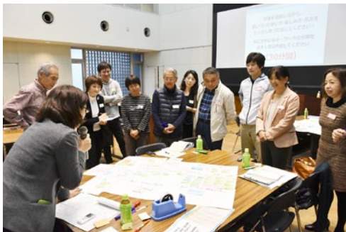
▲市民参加によるワークショップ