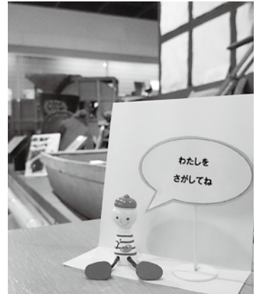
▲こびとは何人かくれているかな?

6月15日㊤9時30分～16時30分所 要時間15分程度／内容=美術館・郷 土資料館でおススメ展示品の近くに置 かれたこびと探しをしてみませんか? こびとを全部みつけた子には粗品をプ レゼント／定員=50人(先着順)