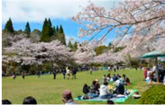
▲桜の季節には多くの観光客が訪れます

づくりや桜の季節以外の魅力づくり及び従来の事後保全的な維持管理から予防保全的な維持管理への転換などによる公園施設の長寿命化に取り組み、市民が憩うすばらしい公園にされたい。