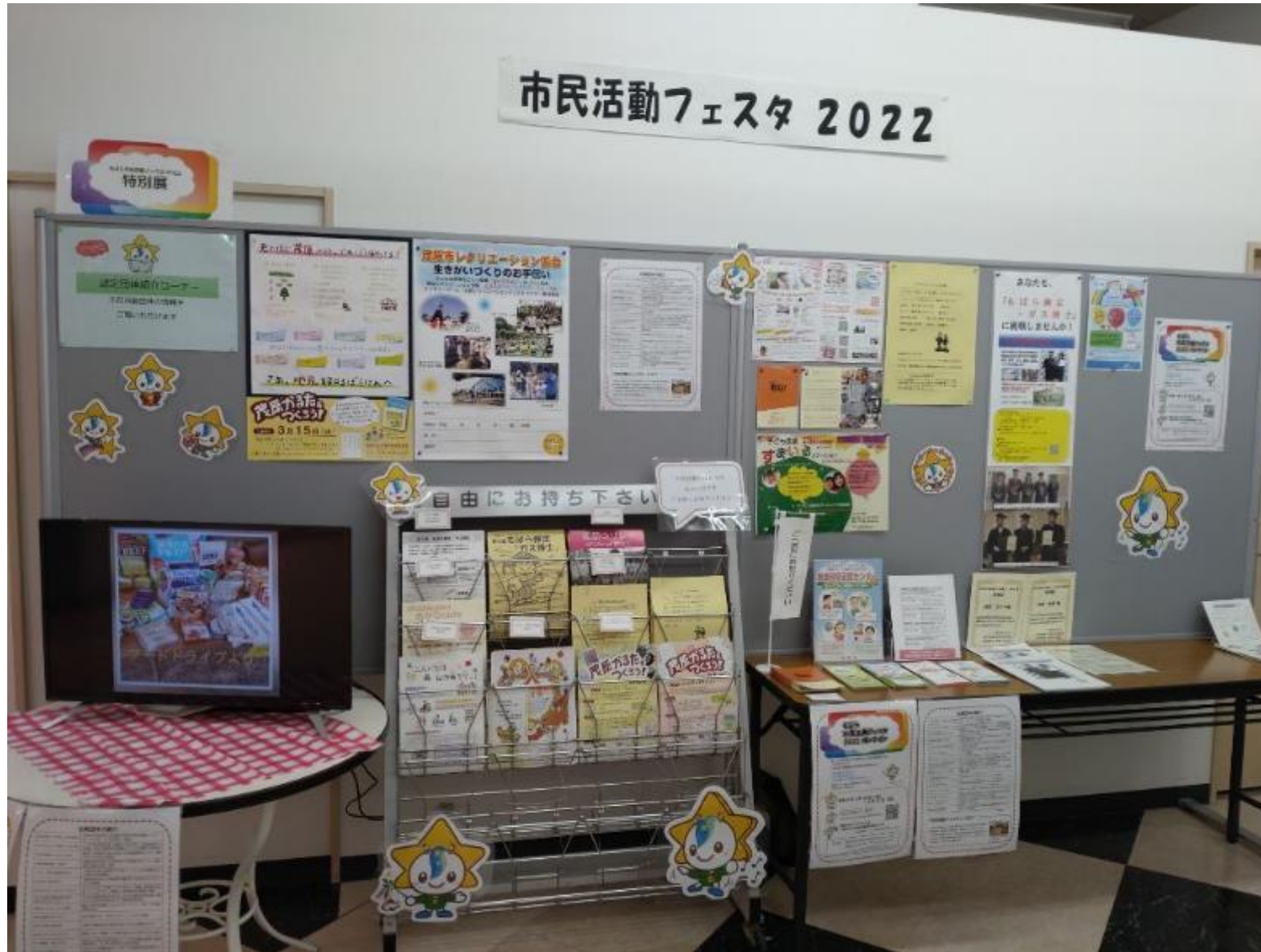
2022特別展の様子 (茂原ショッピングプラザアスモ)