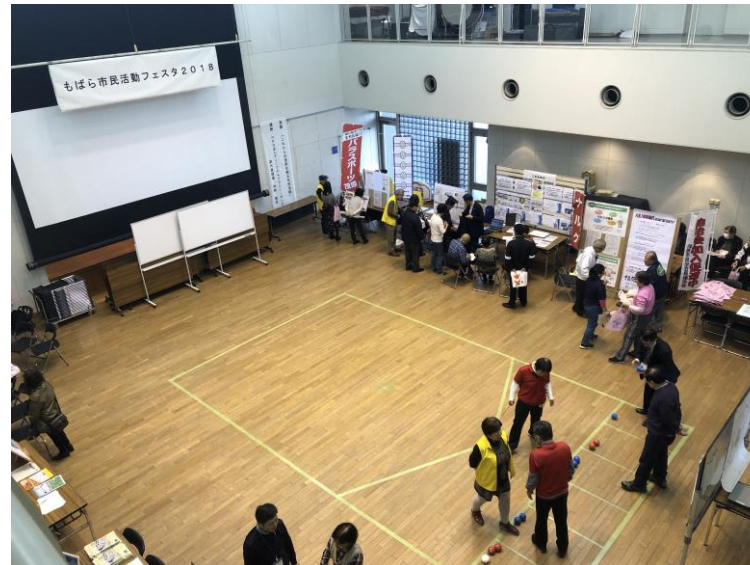
市民活動フェスタ2019の様子 (市役所市民室)