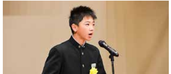
▲少年の主張大会では、中学生14人が発表