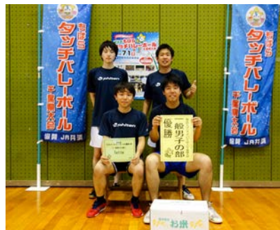
一般男子の部優勝 Sette