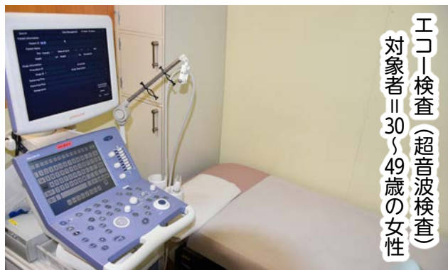
エコー検査（超音波検査） 対象者 30～49歳の女性