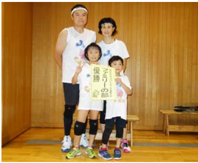
ファミリーの部優勝 チーム南国A

売ブースを設け、茂原商工会 議所青年部による「星のソー ス」の販売や、JA長生によ る地元野菜の販売、旬の里 ねぎぼうずによる今話題の 「ねぎっぺ餃子」の販売もあり、 大いに賑っていました。 次回の大会は、平成31年7 月8日⑩に開催しますので、 ぜひご参加ください。