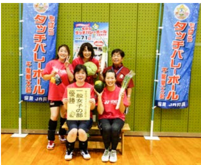
一般女子の部優勝 ドリームS