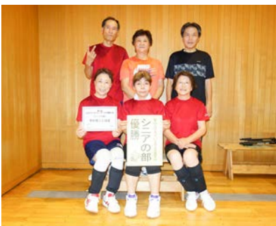
シニアの部優勝 中の島じじばば