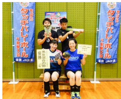
男女混合の部優勝 C.V.C