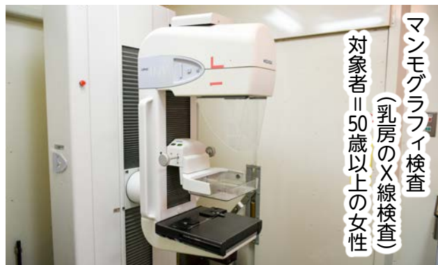
マンモグラフィ検査 （乳房のX線検査） 対象者 50歳以上の女性

※40～49歳は、エコー検査とマンモグラフィ検査を毎年交互に実施します（平成30年度はエコー検査）。 ※受診希望日の10日前までにお申し込みください。 ※平成29年度に受診した方に、受診票等を郵送しています。