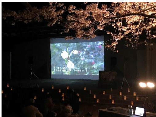
機材の貸し出し（夜桜シネマ）