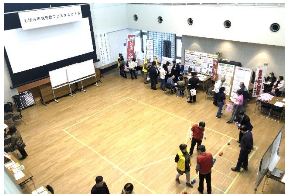
もばら市民活動フェスタ2018