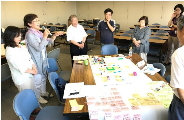
交流会（市民活動支援センターのありたい姿について）