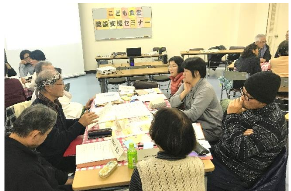
協働提案事業補助金活用事業（子ども食堂設立支援講座）