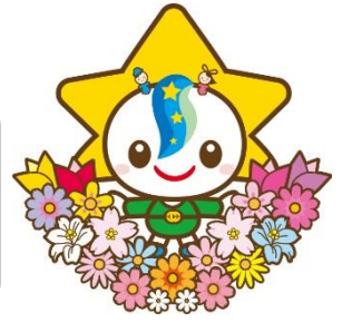
茂原市マスコットキャラクター モパリン

茂原市市民活動支援センターは、「茂原市まちづくり条例」の基本原則に基づく「協働によるまちづくり」の推進を図るため、まちづくりの担い手（自治会、市民活動団体及び地域まちづくり協議会等）の拠点として設置されました。