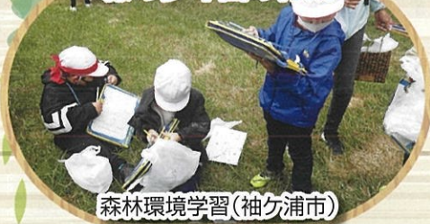
森林環境学習(袖ヶ浦市)