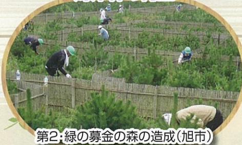
第2: 緑の募金の森の造成(旭市)