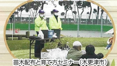
苗木配布と育て方セミナー(木更津市)