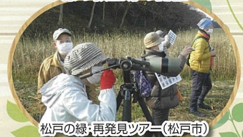
松戸の緑・再発見ツアー(松戸市)