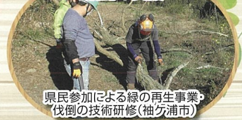
県民参加による緑の再生事業・ 伐倒の技術研修(袖ヶ浦市)