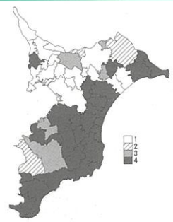
図 58 糖尿病予備群・該当者(女)