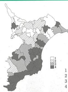
図 57 糖尿病予備群・該当者(男)