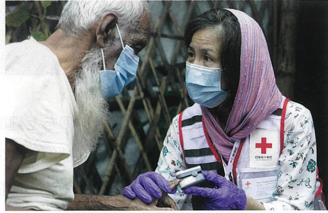
海外の紛争や災害で苦しむ人々を支援します。