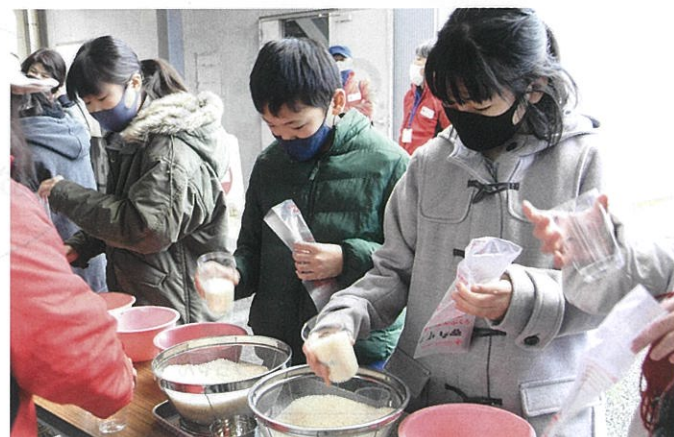
赤十字活動への参加を通じて豊かな心をもった子どもたちの育成に取り組みます。