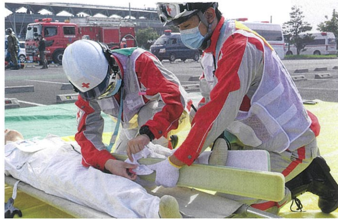
感染症流行下においても災害救護活動を実施します。

日本赤十字社は、苦しんでいる人を救いたいという思いを結集し、人のいのちと健康、尊厳を守ることを使命として、世界192の国と地域に組織された赤十字・赤新月社と連携し、国内外において様々な人道的活動を展開しています。