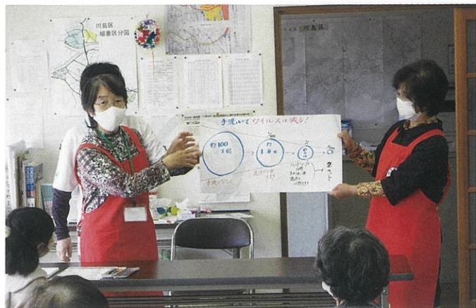
赤十字奉仕団が地域における高齢者の支援などの様々なボランティア活動を行います。