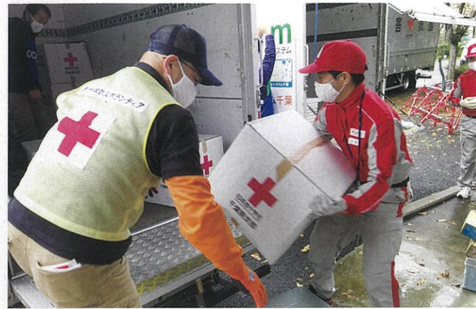
大規模災害や火災・水害等により被災された方に迅速に救援物資をお届けします。