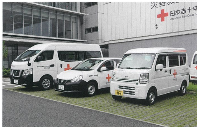
災害時に必要な施設や資機材を整備します。