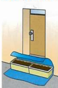
プランターとレジャーシートとの組合せ