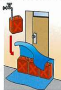
ポリタンクとレジャーシートとの組合せ