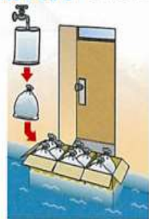
水を入れたビニール袋とダンボール箱の組合せ