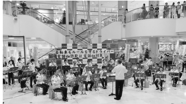
7月3日 茂原警察署の安全・安心フェスタ 茂原ショッピングプラザアスモにて、県警音楽隊の応援を得て交通・防犯の安全・安心のための広報を行いました。