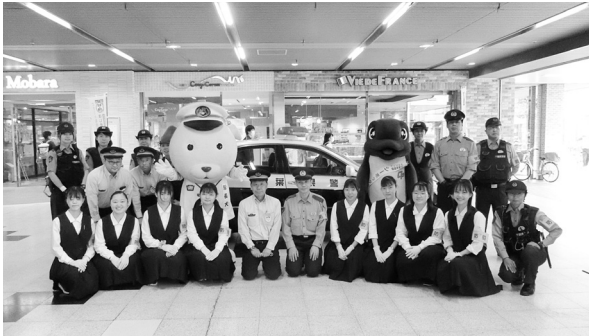
6月1日 チカン撲滅防犯キャンペーン J R茂原駅にて長生高校女子生徒の応援を得て、チラシを配布しながら、痴漢被害防止の声かけを行いました。