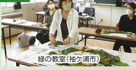
緑の教室(袖ヶ浦市)