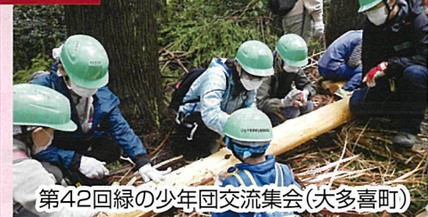
第42回緑の少年団交流集会(大多喜町)