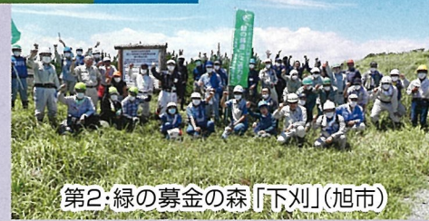
第2:緑の募金の森「下刈」(旭市)