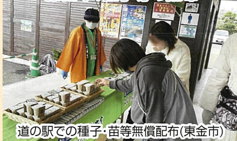
道の駅での種子・苗等無償配布(東金市)