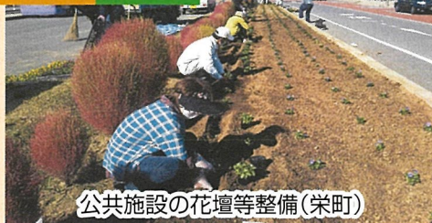
公共施設の花壇等整備(栄町)