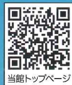
当館トップページ