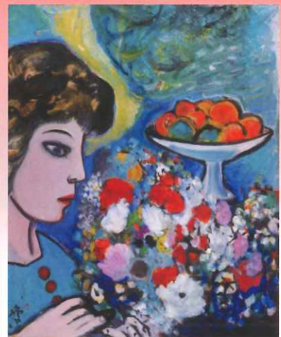
鳩川誠一 作品 ※いずれも当館蔵 「ダリア花(左上)」、「祭の夜道」(右上)、 「千葉の海」(右中)、 「愛」(左下)、「モジリアオイ」(中下)、 「花と女」(右下)