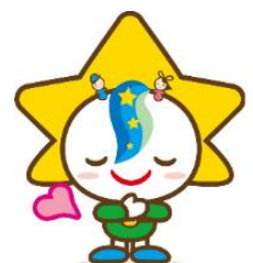
茂原市マスコットキャラクター モバリん