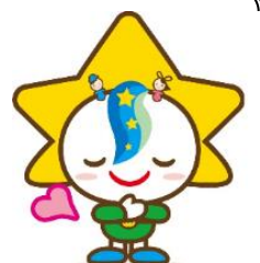
茂原市マスコットキャラクター モバリん