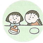
他のきょうだいとは著しく差別的な扱いをすること