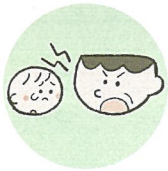
言葉で脅したり、脅迫すること

体罰は暴力でこどもの身体を傷つけるもので、心理的虐待は暴言などでこどもの心に深い傷を負わせるものです。こども本人への暴言でなくとも、配偶者や家族に対する強い言葉などもこどもの心を傷つけ、発達に影響する可能性があります。