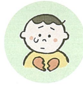
こどもの心や自尊心を傷つけるような言動をしたり、繰り返し言うこと