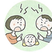
配偶者への暴力や暴言をこどもに見せること