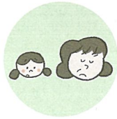
こどもを無視したり、拒否的な態度を示すこと