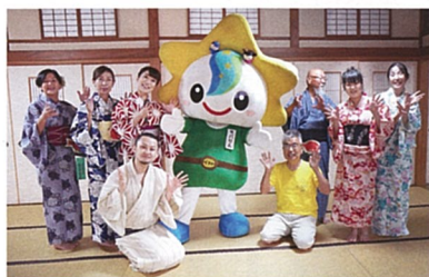
もばら星おどり 集合写真

動画を見たら踊りたくなって、一層茂原が大好きになりますよ。 茂原市制七〇周年をお祝いして茂原市の新しい盆踊り歌を制作しました。まずは、スマホをいじれない人もどなたかに頼んで是非一度、動画をご覧ください。