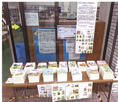
東部台文化会館での無料頒布状況

補充しながら、約一か月間の展示、頒布でしたが、多くの方にお持ち帰り頂けて、市民の関心の高い事が分かりました。今後も多くのみなさんに読まれる作品を発表していきたいと思えます。