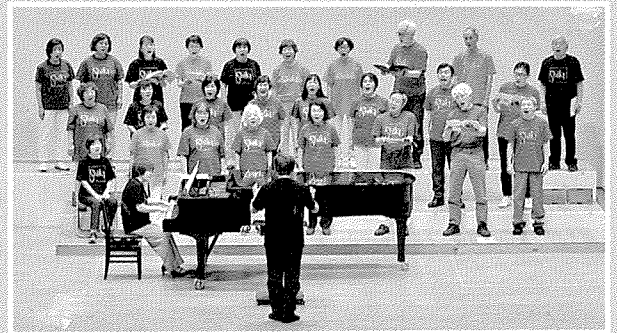
第49回 南総コーラスのついでい 岬ふれあい会館 2023年6月11日

また、毎年12月に開催している「冬の夜の小さな音楽会」(チャリティー)も46回を数えます。「小さな音楽会」として始まったこの演奏会は、茂原の歌う仲間、音楽する仲間たちがたくさん加わり、企画から準備・本番と手作りの楽しく暖かな演奏会となってきました。最近、高校生の参加も得て世代を超えた演奏会となっています。