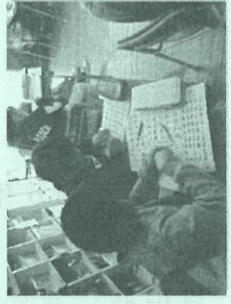
福祉教育の実施 (点字体験教室)