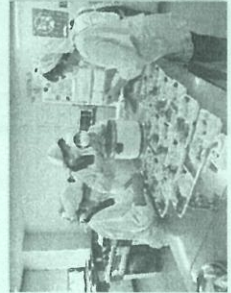
見守り型食事サービスの調理風景