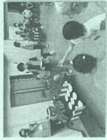
地区社会福祉協議会活動 (地域交流会)