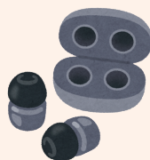
ワイヤレスイヤホン