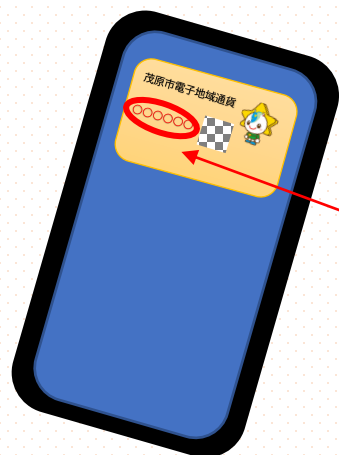
スマートフォンアプリ (イメージ)