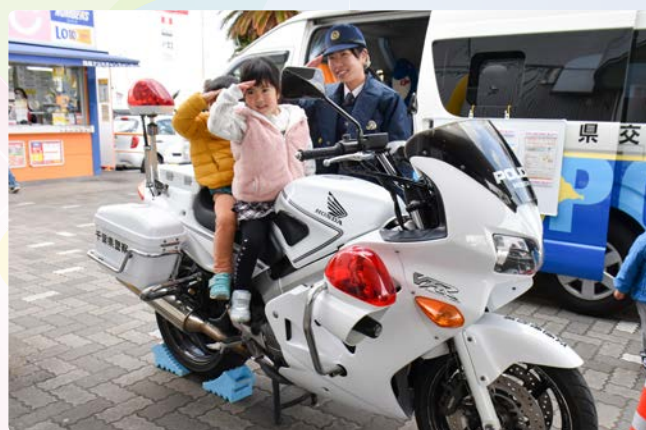
▲白バイにまたがって敬礼！