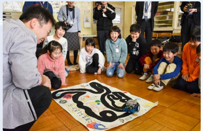
▲児童たちが描いたコースを走りました

児童たちは、自分たちで描いたコース上でロボットカーが自動走行する様子に歓声を上げて見入っていました。