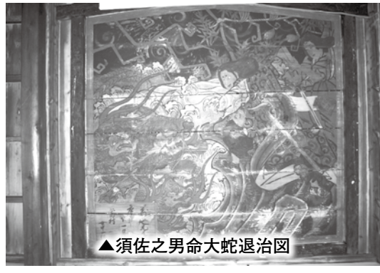
▲須佐之男命大蛇退治図

接ぎで山型の額に納められた大作である。須賀神社の祭神でもあるスサノオには、怪物「八岐大蛇」を退治し、後に妻となる稲田姫を救う英勇譚があるが、絵馬の場面は、今まさにスサノオがオロチに挑むところである。波は荒れ狂い、稲妻が走る。オロチの八つの頭が見え隠れする。描か