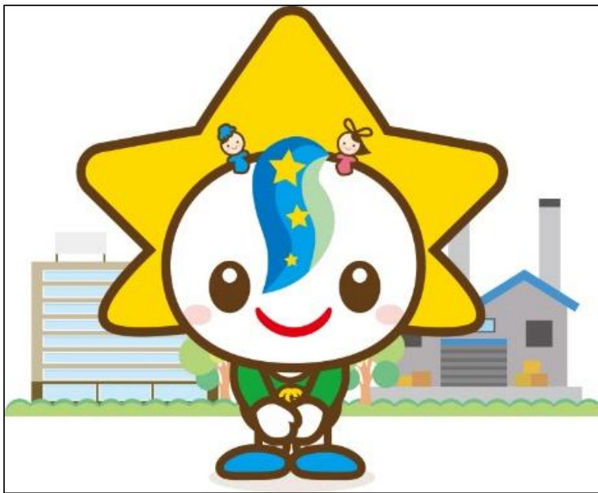
茂原市マスコットキャラクター モバリん