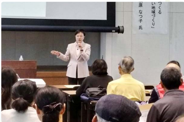
▲講師のユーモア溢れる軽快な話し口に惹き込まれました