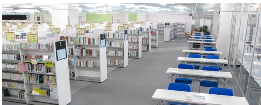
▲茂原市立図書館内

お問い合わせは、 監査委員事務局（9階） TEL 1560、FAX 1607へ。