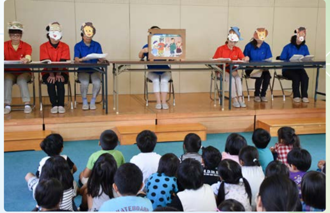
▲園児たちは気持ちのこもった読み聞かせに聞き入っていました

紙芝居の後、反射ストラップなどの啓発物が手渡されると、園児たちはうれしそうにしていました。