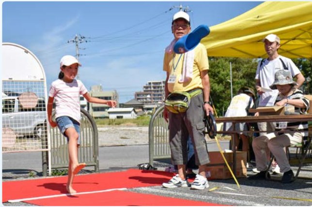
▲第15回を記念して「スリッパ飛ばし大会」も行われました