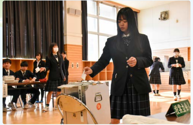
▲機材はすべて実際の選挙で使用するものです

千葉県と茂原市の選挙管理委員会職員が講師を務め、生徒たちは選挙の意義や仕組みなどについて講義を受けた後、市長選を想定した模擬投票を体験。3人の生徒が立候補者役となって演説を行い、生徒たちは公約を吟味し、本番さながらに1票を投じました。投票後は代表生徒が開票作業も体験し、選挙の流れを学びました。