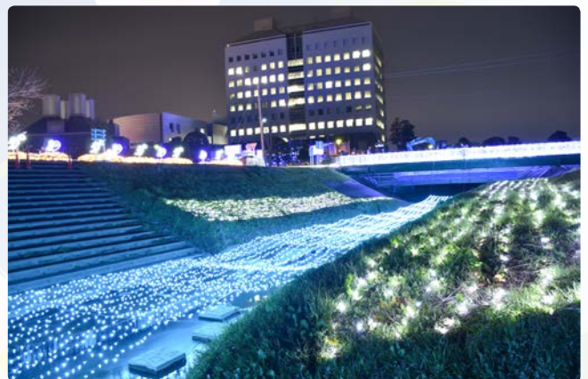
▲会場周辺が華やかな光に包まれました