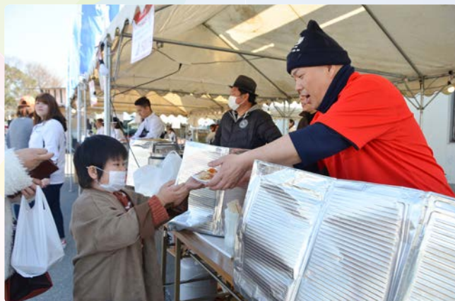
▲食のブースではピリ辛料理が提供されました