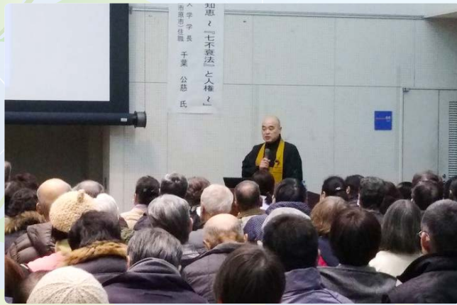
▲195人が参加し、大盛況でした