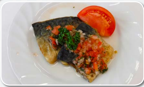
「サバのラビゴットソース」