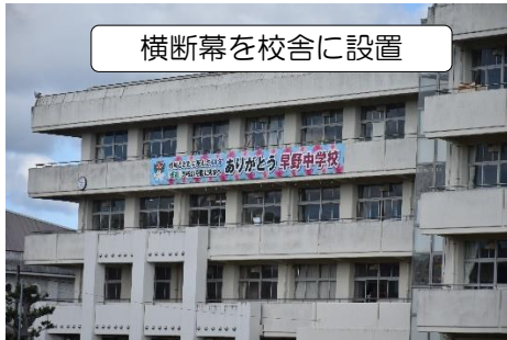
横断幕を校舎に設置

令和8年3月21日に、閉校式を挙りました。また、閉校式当日は、地域主催の「閉校記念イベント」や「五郷桜まつり」も併せて開催され、早野中学校の44年間の歩みを振り返り、皆で感謝の気持ちを表しました。