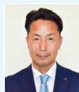
副議長 田畑 毅