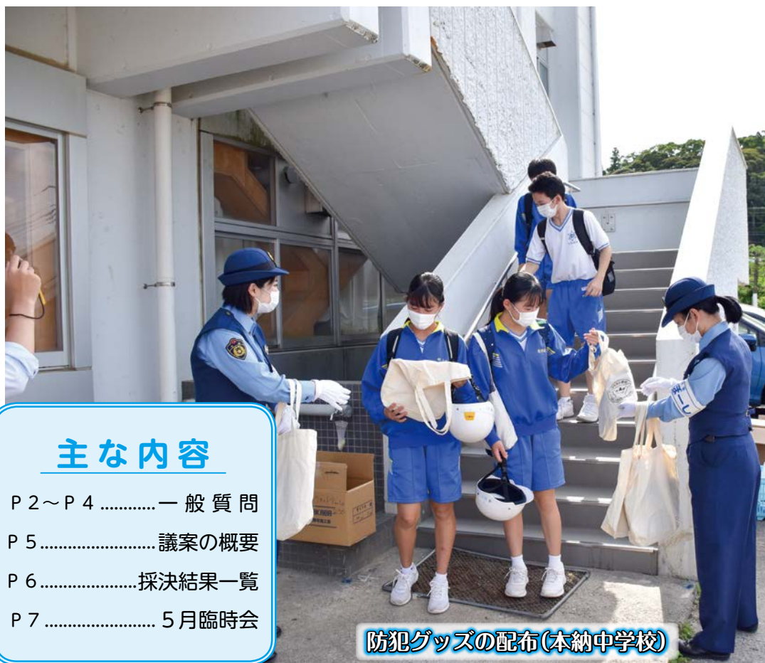
防犯グッズの配布(本納中学校)